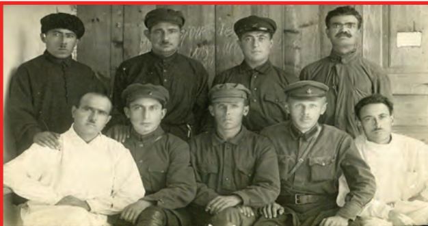
Azərbaycanın rayonlarından birində hərbi komissarlığın şəxsi heyəti. 1930-1939 -cu illər